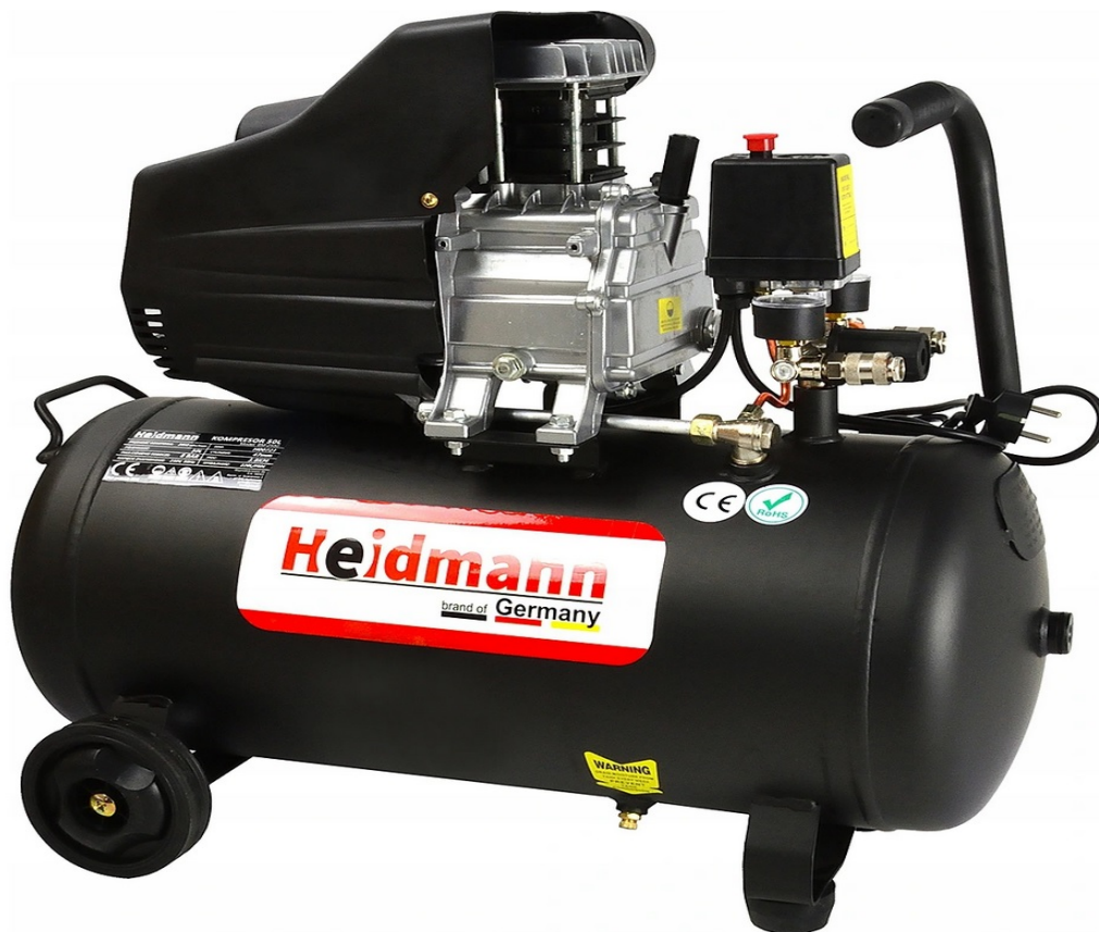
OLIECOMPRESSOR COMPRESSOR 50L 8bar HEIDMANN H00721

Een van de krachtigste 50 liter compressoren op de markt!